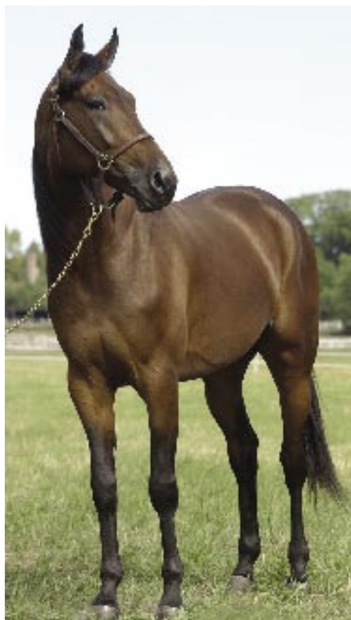
Silvano Caparrini är givetvis extra stolt över fem-åriga topptravaren Calvin Capar.