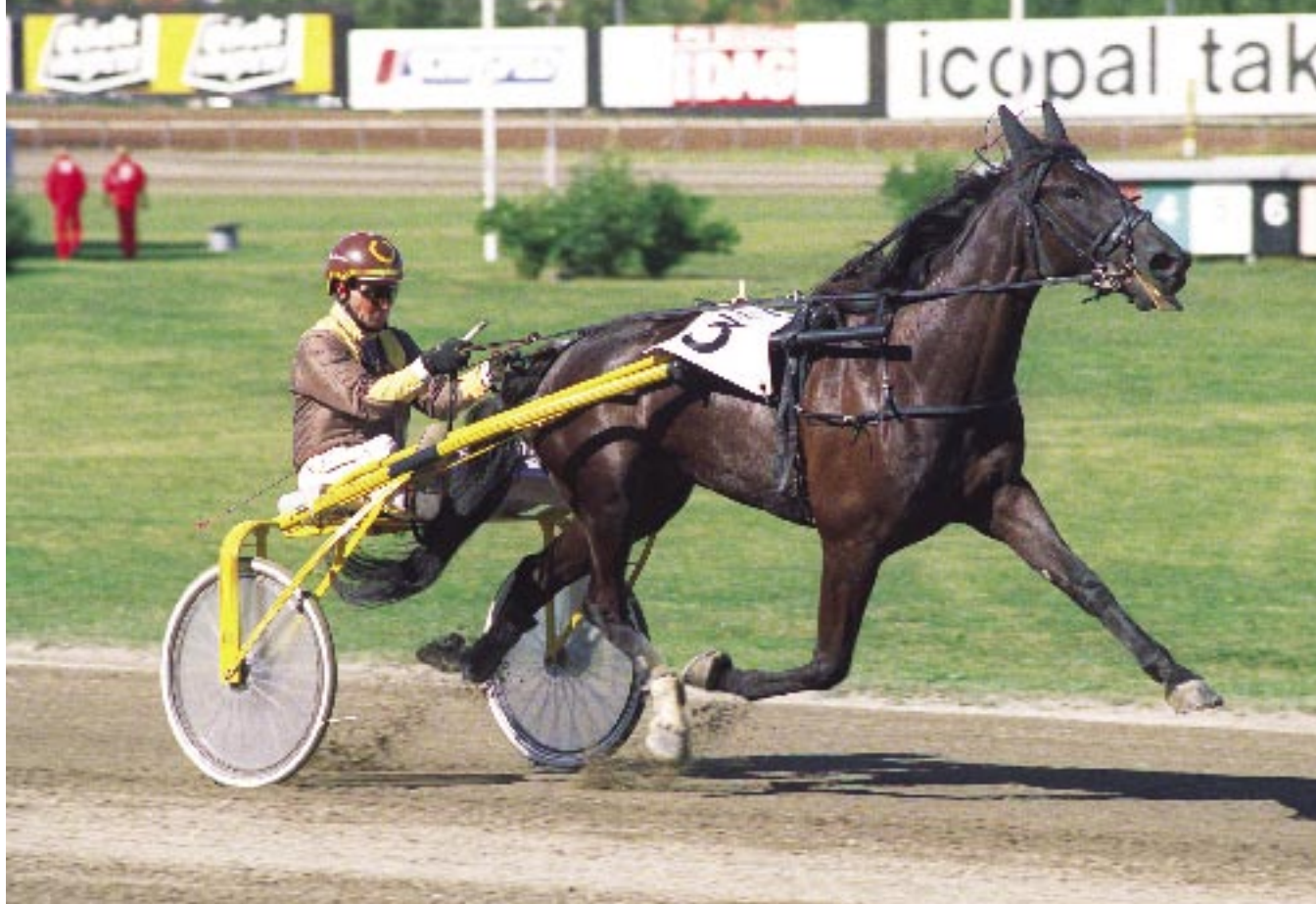
Drottning Sund blev andra vinstrikaste sto 1990 och har bland annat lämnat italienske Zip Kronos. Bland avkommorna saknas emellertid någon riktig stjärna – ännu.

lingskarriär framfött sju avkommor, varav fyra har uppnått startbar ålder (två år). Efter två "floppar", Agria Racing (två starter, 10 000 kronor insprunget) och Queens Daughter L. (ostartad) är femårige Crown Prince L. hennes hittills mest framgångsrika avkomma med dryga 350 000 kronor intjänat. Treårige Viking Kronos-sonen L.Of A Prince har inlett karriären med en seger på åtta starter. Queen L. har endast tillförts första klassens hingstar och sett till hela hennes produktion är resultatet absolut inte dåligt – men heller inte enastående.