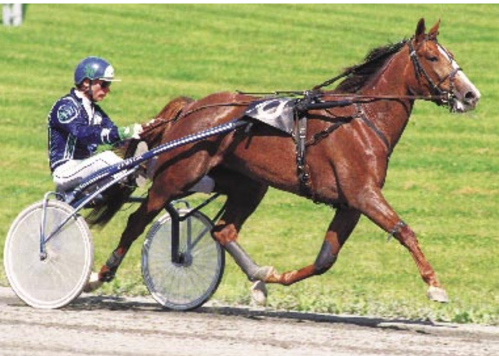
Queen L. – vinstrikaste 4-åriga sto 1990 – segrade bl a i Svenskt Travderby 1990, Stochampionatet 1990 och Prix D'Amérique 1993. Hennes resultat i avelsboxen är godkänt – men inte uppseendeväckande.