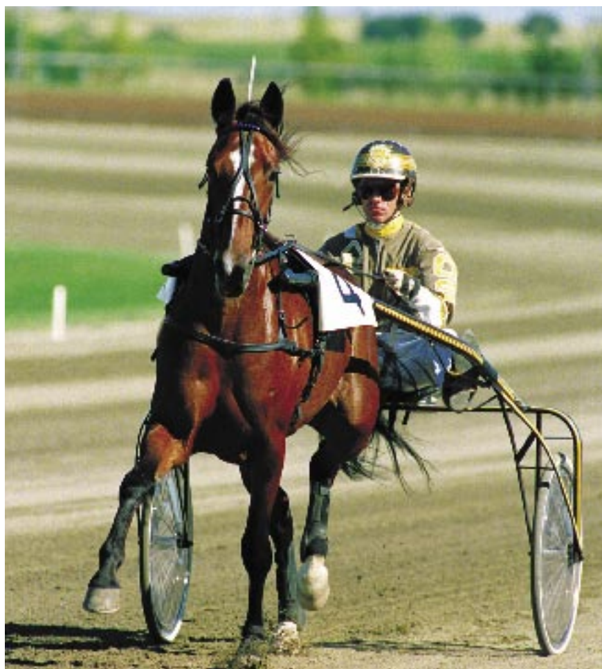
Summer Crown – tredje vinstrikaste sto 1990 – har överlag hållit en relativt bra och jämn produktionsnivå med avkommor som bland andra Texas Haro (e Texas), försöksvinnare i Silverdivisionen 2001 samt Golden Haro (e Smasher), vinnare av en E3-uttagning 2003.

– Hon fick så småningom problem med ett framknä och trots att vi försökte gick det inte att få igång henne igen, så vi betäckte henne med Spotlite Lobell, berättar ägaren Knut