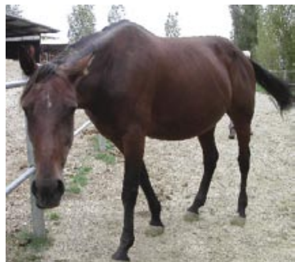
Foxy'n Rowdy, mamma till Calypso Capar och fostermor till Calvin Capar, är nu dräktig med Italiens nationalhelgon, Varenne.

"Mitt mål är att få fram en häst av toppkvalitet"