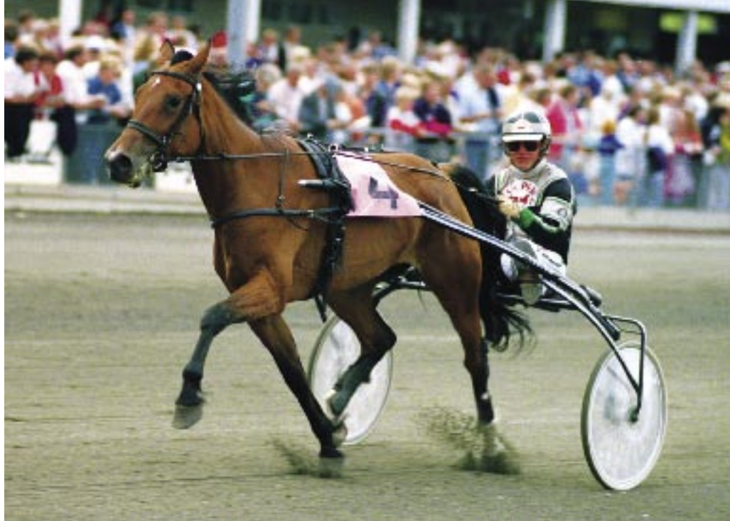
Play Around – åttonde vinstrikaste sto 1990 – måste anses ha lyckats bäst i aveln av de tio stona. Hennes mest namnkunniga avkomma är Flying Irishman-sonen Energetic som bland annat vann Svenskt Mästerskap 2002.

Hennes tredje avkomma, Energetic (e. Flying Irishman), slutade tvåa i såväl Svenskt Travkriterium som korta E3-finalen som treåring. Året därpå vann han Breeders' Crown, och hans tyngsta titel som äldre är Svenskt Mästerskap. Energetic försörjer sig numera väl i Frankrike, och har till och med hunnit prova på en start i monté – om än utan större framgång. Yngre systemen Fun And Games (e. Cocktail Jet) har passerat 100 000 kronor, medan den ytterli-gare ett år yngre brodern Game Set-ter (e. Tenor de Baune) segrat i klass II-försök och dragit ihop 345 500 kronor. Play Around måste därmed