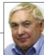
Sammanställt av: Olle Jönsson

1991: 39 ston 1992: 80 1993: 70 1994: 68 1995: 98 1996: 118 1997: 179 1998: 317 1999: 428 2000: 446 2001: 395 2002: 381 2003: 461 2004: 508