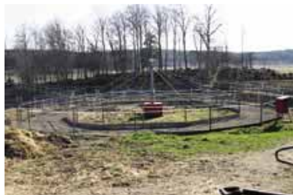
Berga gård har byggts upp till en komplett träningsanläggning där inget saknas från rundbana till skrittmaskin.