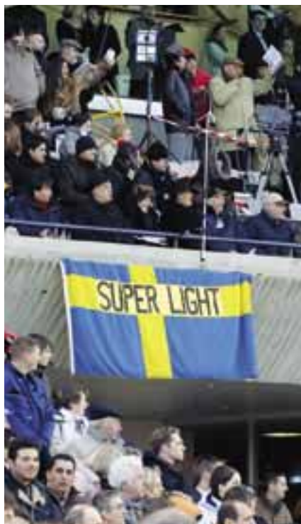
Super Light hade självklart sin egen hejaklack med flagga och allt på Vincennes.