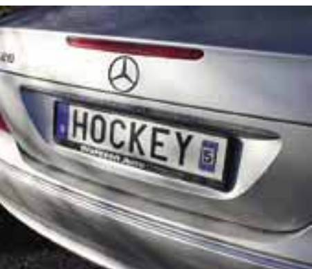
Ingen tvekan om vem som kommer här.