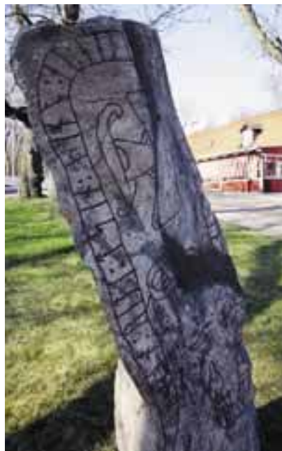
Runstenen vittnar om att Berga gård ligger på historisk mark.