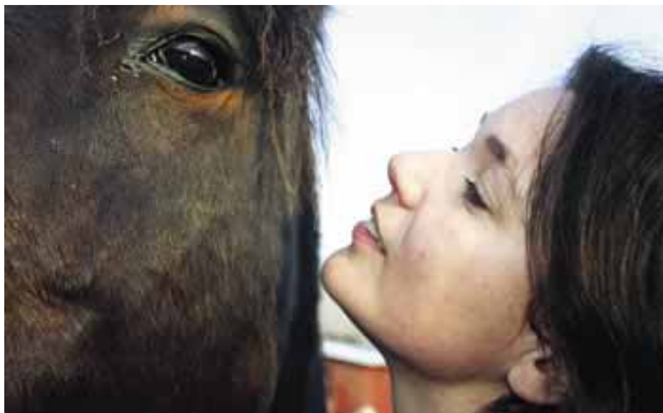
Travhästen är älskad inte minst för sitt goda temperament – den är oftast lätthanterlig, lättlärd och lyhörd.

– Många travhästar har en ridduglighet som gör att de ska kunna gå upp emot medelsvår dressyr även om det tar lite tid att komma dit. Men det vi också konstaterade var att vi inte kan gå in och lära ridsporten hur