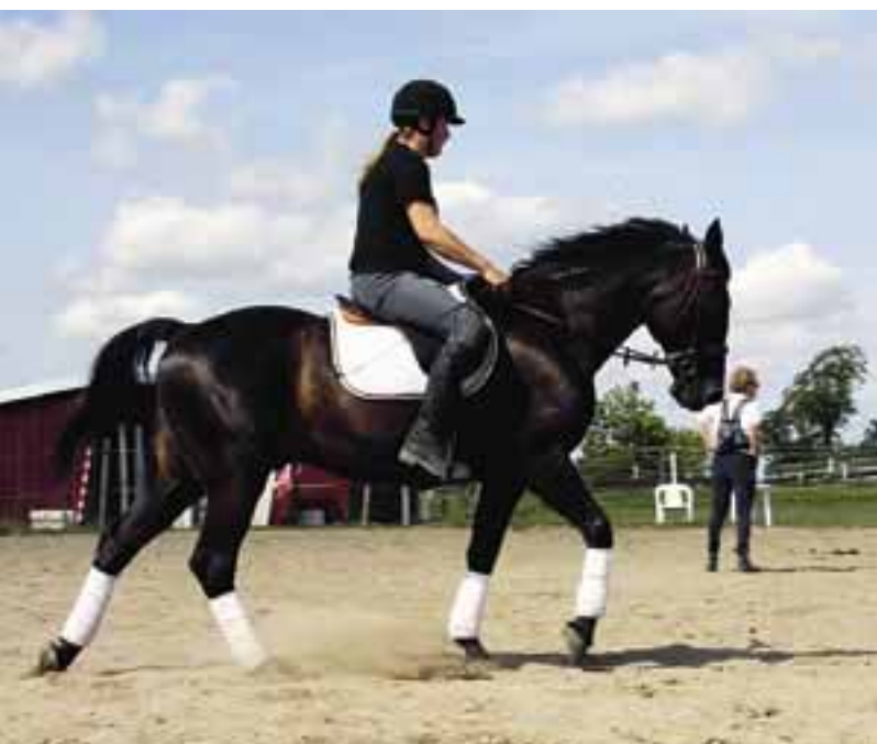
Ridtravvarföreningen anordnar egna träningstillfällen och tävlingar.