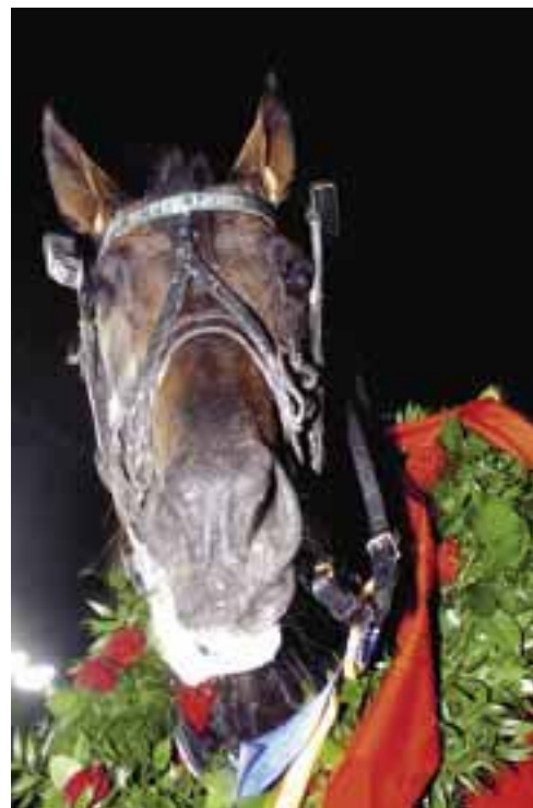
Super Light har visat sig vara rena rama turlotten för ägarna i Stall Valvet.