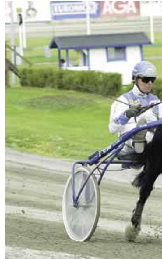
"Hockey" har gjort sig känd för sin fina hand med ston och

Speciellt tävlingshästarna får en hel del extra för att hållas på gott humör – skogsturer, promenader, ridträning, extra pyssel av sina skötare. Mycket utevistelse och frisk luft prioriteras och unghästarna går på lösdrift i mindre grupper.