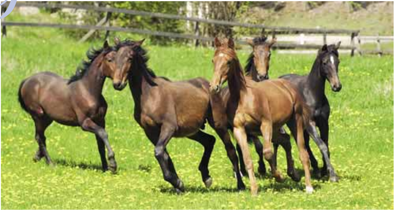
Förslaget till ett forskningsprogram för hästnäringen syftar bland annat till att långsiktigt få friska och sunda hästar.