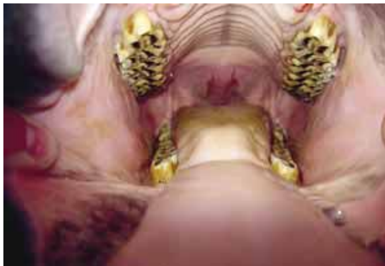
Så här kan en normal mun se ut.

– Traditionellt är ett travbett 11,5-12,5 cm långt men det är bara riktigt stora travhästar som behöver