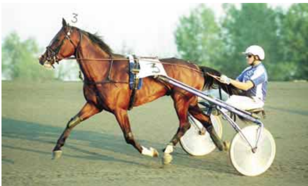
Västerbo Tomorrow slutade bland annat sexa i Svenskt Travderby och exporterades senare till Holland där han idag verkar som avelshingst.