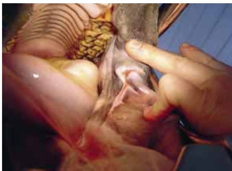
Den här hästen har råkat ut för en tryck- eller klämskada i mungipan på grund av felaktig betsling.