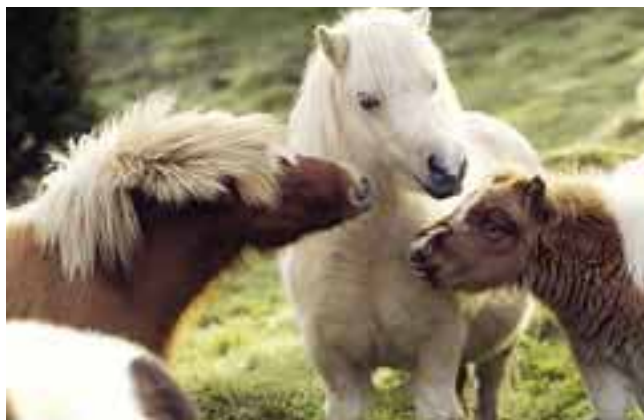
Shetlandsponnyer tillhör de raser som minst drabbas av skador och sjukdomar.

Klart är dock att för rid- och sällskapshästar är valacker är betydligt mer skadedrabbade än både hingstar och ston. Att hingstar ligger lägre kan ha sin