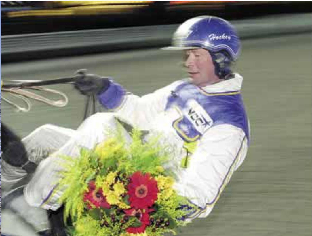
Hittills har "Hockey" fått segerdefiler 14 gånger i år. Förra året blev det sammanlagt 57 segrar.

Då kunde "Hockey" se tillbaka på flera framgångsrika, men hektiska, år. Han tävlade sju dagar i veckan,