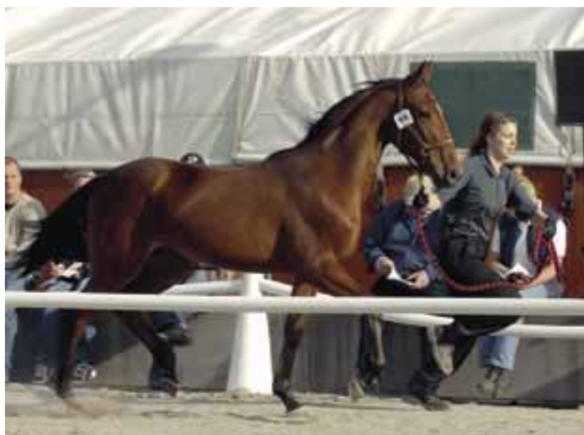
Nr 66 Wellbred Boko såldes på 2005 års Elitauktion för 200 000 kronor.

Kriterieauktionen äger rum den 28-30 september. Sista anmälningsdag är den 7 juni. Precis som i fjol kom-