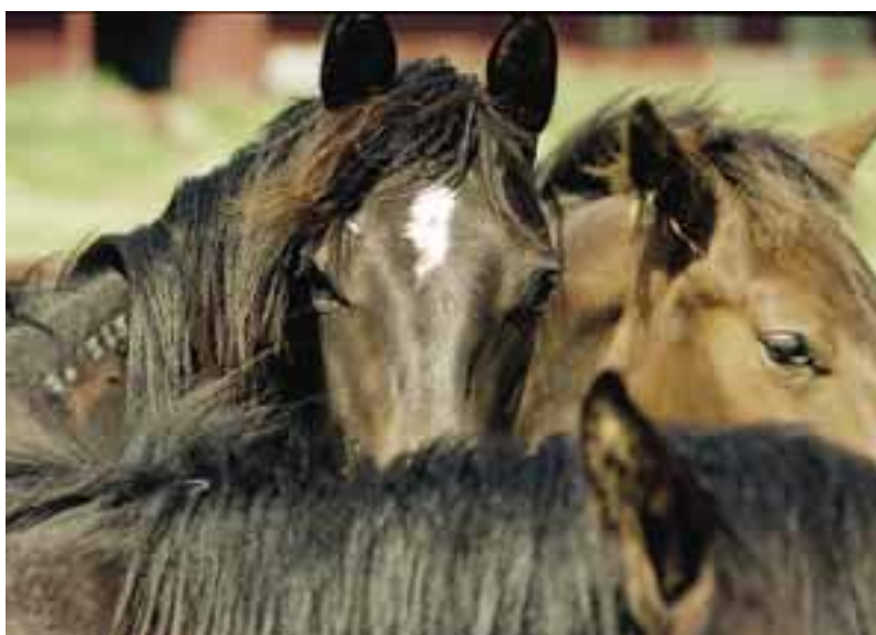
Djurskyddsmyndigheten arbetar nu med en översyn av nya föreskrifter i syfte att öka möjligheten för hästar till att ha ett naturligt beteende.

Djurskyddsmyndigheten vill se att hästarna har någon form av daglig "lagstadgad rörelserätt" och kunna röra sig fritt ute. Då blir det stopp